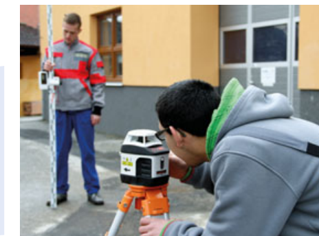
Také zedníci z Chroustovic musí ovládat moderní techniku.