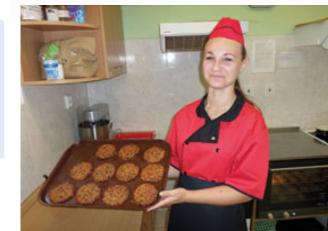
Tyto krásné a voňavé placičky dokáží upécti budoucí kuchařky.