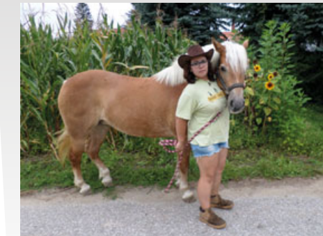
Mezi nejatraktivnější formu zábravy chroustovických žáků patří nepochybně jízda na koni.