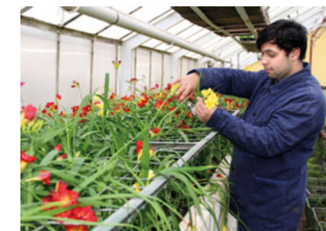
V prostorných sklenících pečují mladí zahradníci také o tyto krásné květiny.