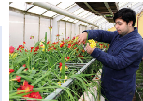
Kytkám se ve zmodernizovaném skleníku náramně daří.