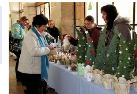
Při adventních trzích v Chroustovicích patří prodejní místo s výrobky žáků učiliště k nejnavštěvovanějším.