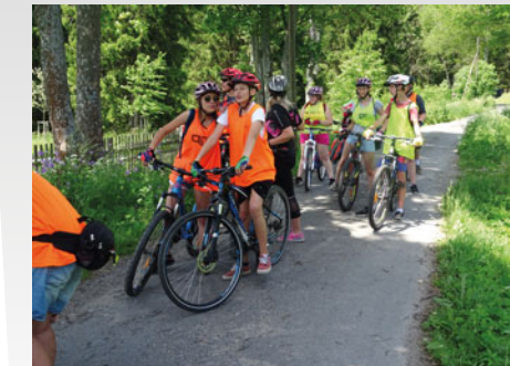
Na sportovní adaptační kurzy jezdí chroustovičtí žáci ke Svatouchu – čeká je zde hodně sportu, ale také pracovních aktivit.

„Cukrář musí být pečlivý a také dbát na detail. Líbí se mi zdobení, ale baví mě vlastně celý proces od přípravy surovin až po samotnou výrobu. Nejraději vyrábím cukroví a dorty. No, a možná se ještě vyučím pekařkou, abych toho uměla víc,“ plánuje talentovaná žákyně.