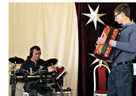
Při premiéře školní soutěže Chroustovice mají talent nebyla nouze o výborná hudební vystoupení.