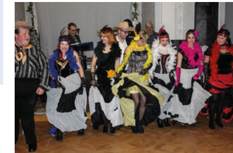
Školní plesy – prokládané zábavními scénkami – se odehrávají přímo na zámku v krásném prostředí Zrcadlového sálu.